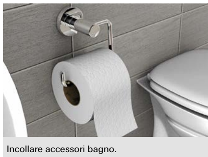
Incollare accessori bagno.