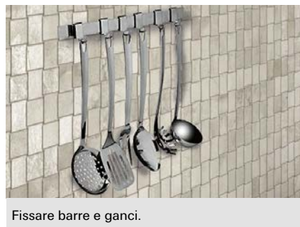
Fissare barre e ganci.