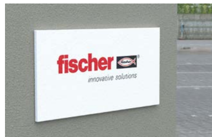
Fissare targhe e decori.