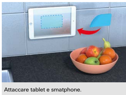
Attaccare tablet e smartphone.