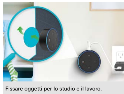
Fissare oggetti per lo studio e il lavoro.