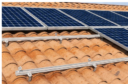
Tetto a falda con tegole