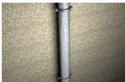
Tubi fumo a sezione circolare