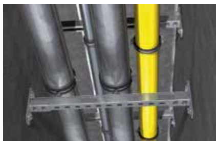
Installazione tubazioni su via di fuga