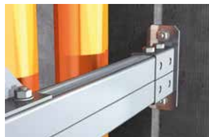
Sbalzo con mensola a sella