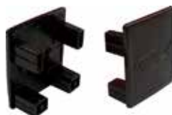
Tappo di chiusura per profilo Solar-fish AK SP